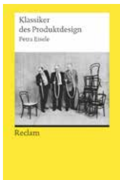
Klassiker des Produktdesigns Petra Eisele Reclam 13,90 €