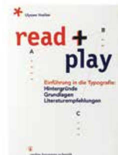
Read + Play Einführung in die Typografie: Hintergründe Grundlagen Literaturempfehlungen Jean Ulysses Voelker Hermann Schmidt 19,95 €