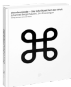
Decodeunicode – Schriftzeichen der Welt Johannes Bergerhausen Siri Poarangan Hermann Schmidt 68 €