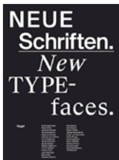
Neue Schriften. New Typefaces. Positionen und Perspektiven P. Eisele, I. Naegele (Hg.) Niggli Verlag 29,80 €