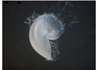
DROPLETS, Simon Fiedler