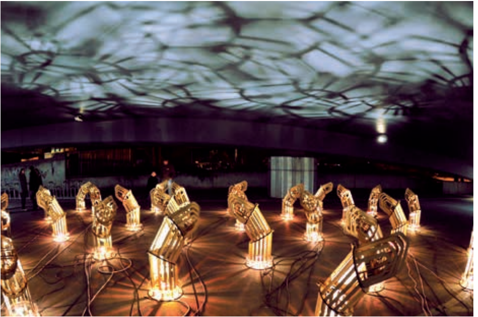
Luminale - Interaktion im Raum