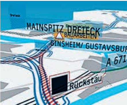
POETRYCLIP, Andreas Gaschka