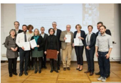
Preisträgerinnen und Preisträger sowie die Jury des Wettbewerbs „Neue Wege in der Lehre“