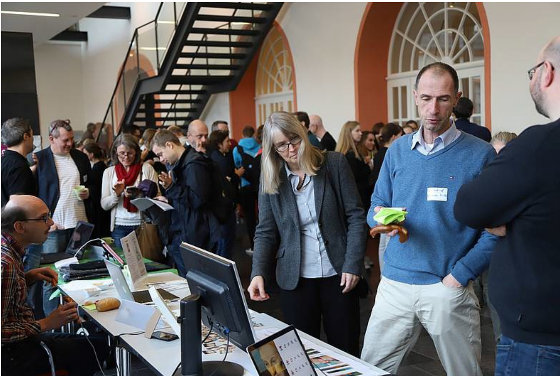
Großer Andrang im Landesmuseum Mainz bei der Präsentation der Projekte des Coding Da Vinci Rhein-Main

Am 1. Dezember wurden in Mainz die Gewinner des Kulturhackathons „Coding Da Vinci Rhein- Main“ bestimmt. Der Wettbewerb war unter anderen organisiert von mainzed und der Universitätsbibliothek Mainz. Über 100 Teilnehmer sorgten dafür, dass am Ende des Ideenpitches 22 Vorschläge mit der Bitte um Beteiligung standen. Mit einer feierlichen Preisverleihung im Landesmuseum Mainz fand der erste Coding Da Vinci Rhein- Main nach fünf Wochen seinen Abschluss. Vergeben wurden Preise für fünf Kategorien, die unter anderem Kreativität und technische Umsetzung gewichtet haben.