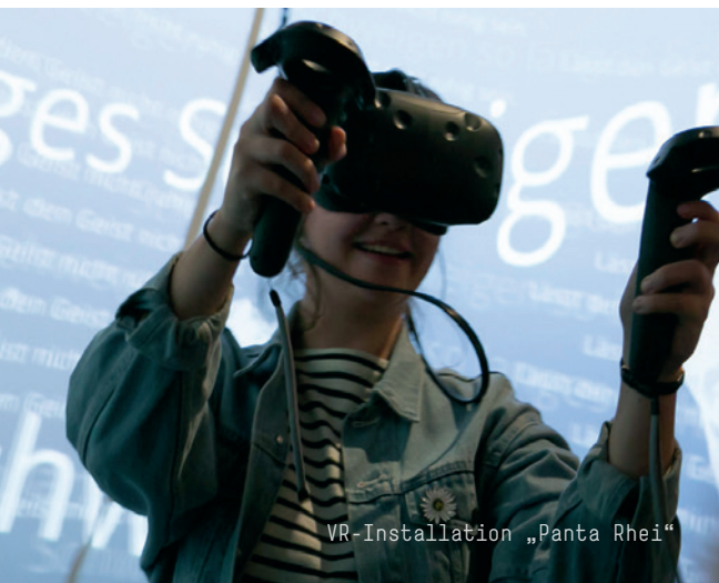
VR-Installation „Panta Rhei“